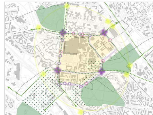
Carte de l'orientation 1 de la stratégie Ville passante: élargir et clarifier la carte mentale du centre

La mission consiste à accompagner la SPLA-IN depuis la définition stratégique de la centralité jusqu'à l'adéquation programme-projet.