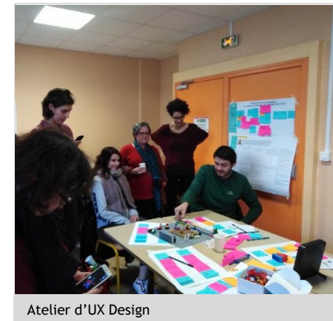
Atelier d'UX Design

Assumant une posture d'AMO tout le long de l'opération, Attitudes Urbaines accompagne l'Université et assure la bonne transcription de ses ambitions fortes pour cette opération, à la fois sur le plan fonctionnel, environnemental et en matière d'évolutivité du bâtiment.