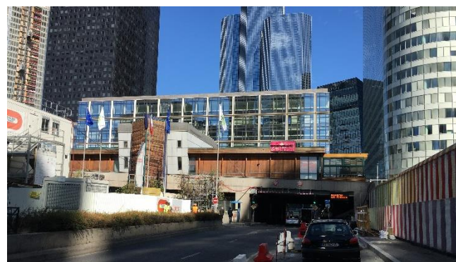
Place de la Statue