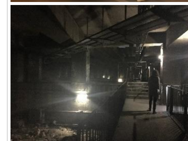
Monstre de Moretti, Entrée du FNAC par la Voie des Sculpteurs, Bassin